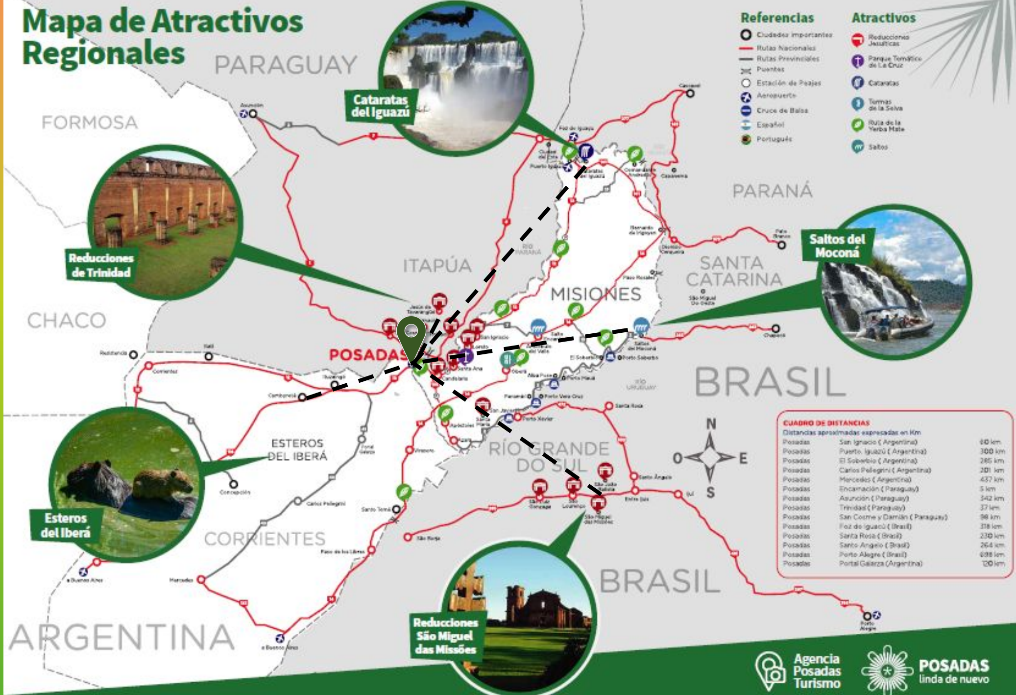
Cataratas del Iguazú