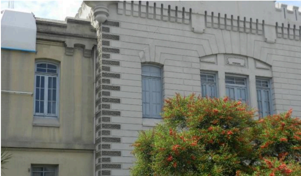
Figura 6- Regimiento y Museo de los Blandengues de Artigas.

El Cementerio del Norte, 14 es una de las cinco necrópolis municipales que se encuentran en el departamento de Montevideo, y es el único que cuenta con un crematorio, de uso tanto público como privado.