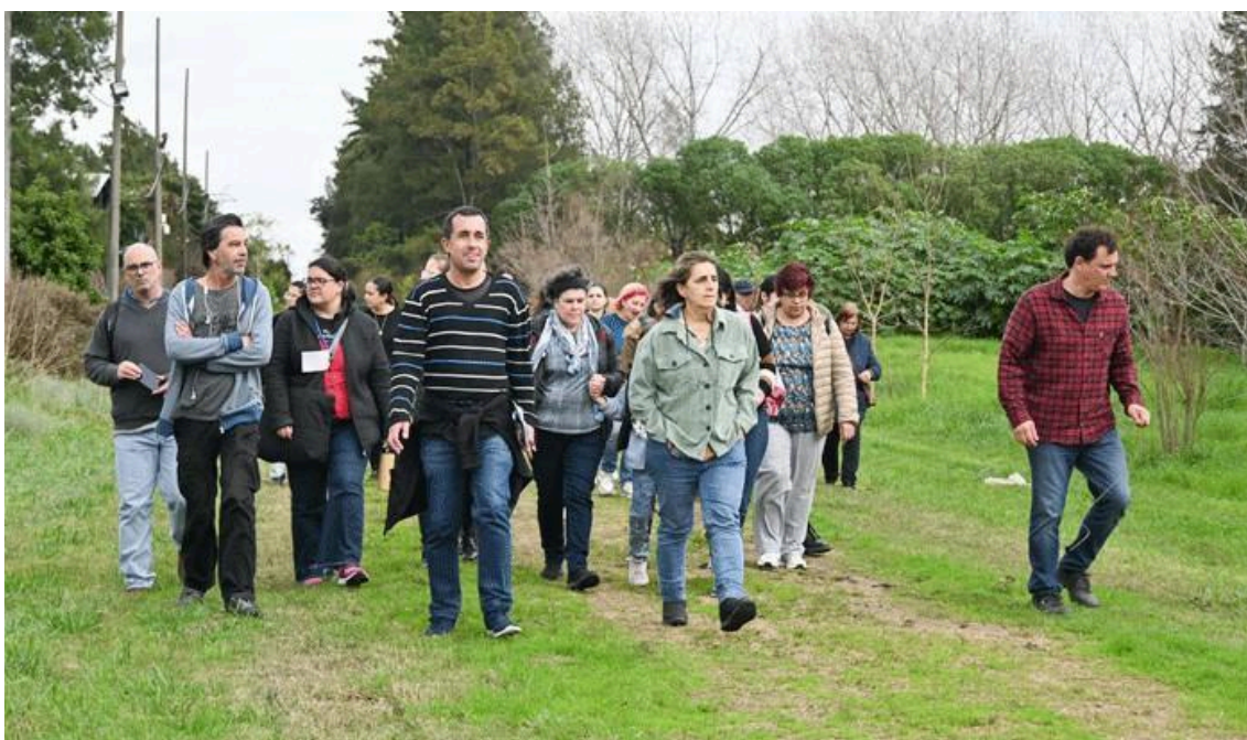
Figura 4: Recorrida por el Vivero Departamental.

Desde hace algunos años, ambos lugares realizan visitas guiadas, principalmente a instituciones educativas, a través de las cuales se busca realizar un acercamiento a los procesos ecológicos.