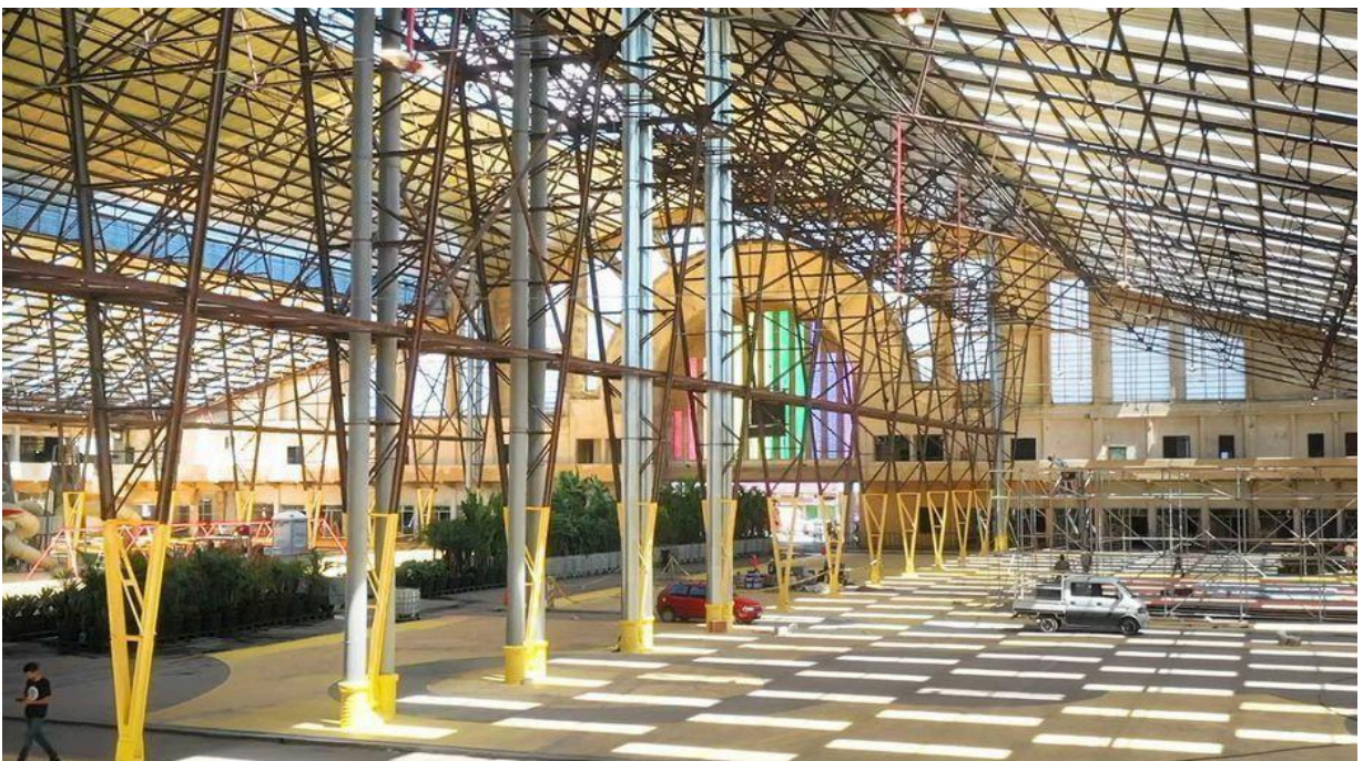
Figura 3- Espacio Modelo.

Por este motivo, desde el año 2019 vecinos y vecinas de la zona mostraron interés en declarar la fachada del Mercado Modelo como Bien de Interés Municipal, lo que ayudará a conservar la memoria e identidad del lugar.