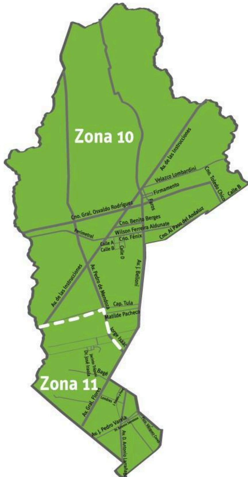
Figura 1. Zonas del Municipio D.