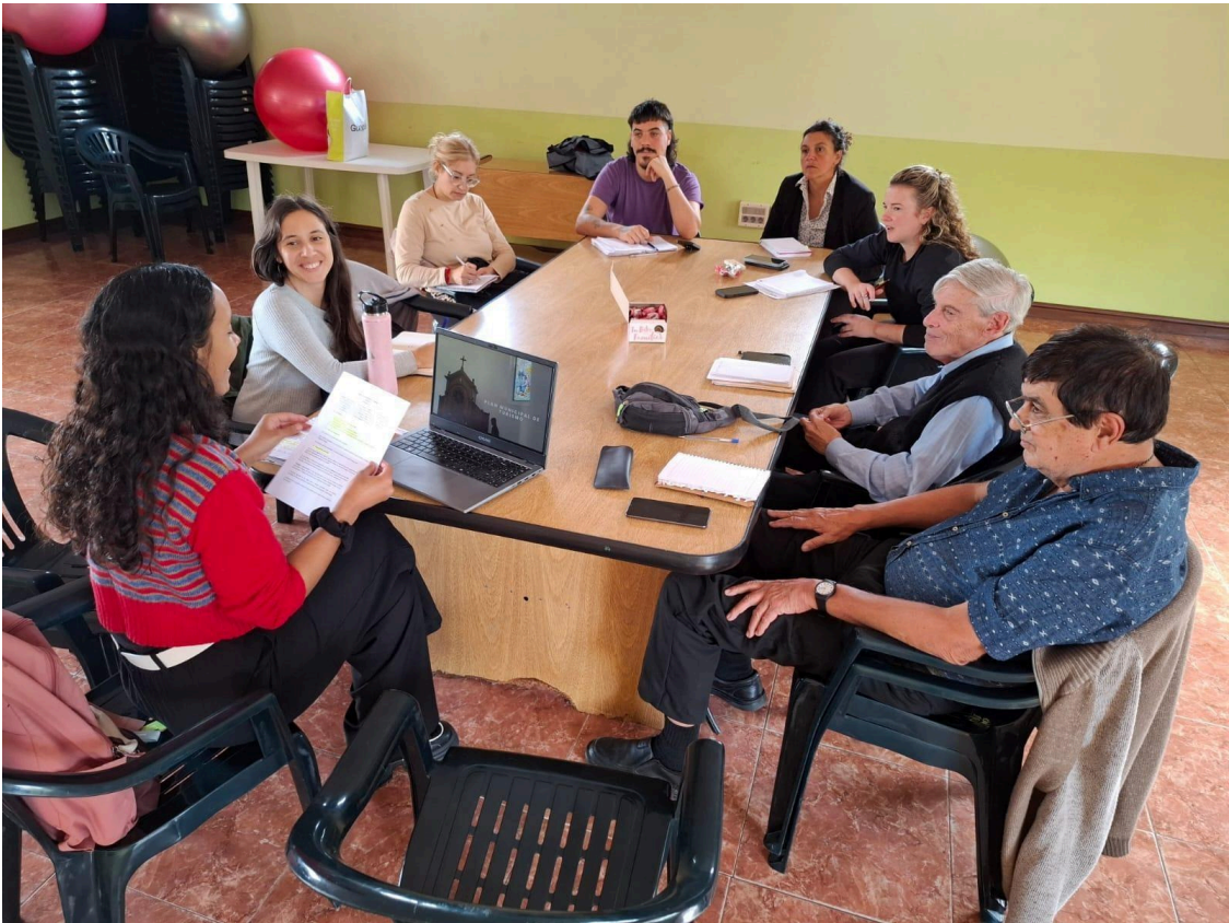
Figuras 7 y 8-Instancias de encuentro de la Mesa de Patrimonio y Turismo del Municipio D.