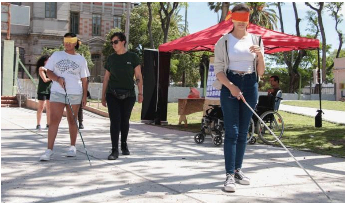
Figura 10- Taller sobre accesibilidad en espacios públicos.