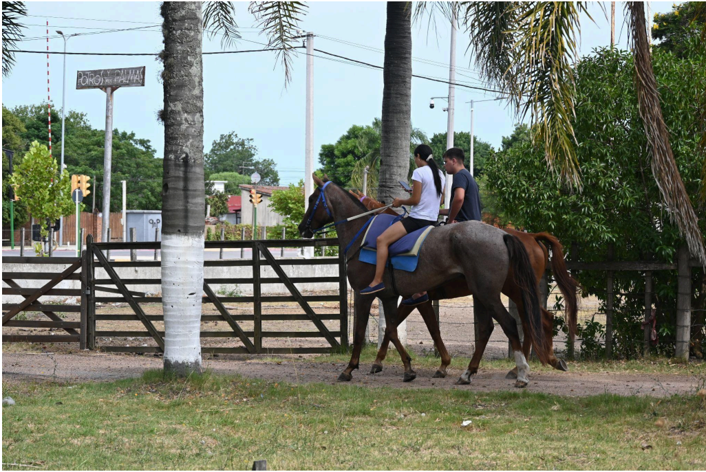
Figura 5- Sociedad Nativista y Tradicionalista “Potros y Palmas”.

Dentro de los elementos potencialmente turísticos, se puede mencionar al Regimiento y Museo de los Blandengues de Artigas 13 . Este espacio es utilizado como sitio de regimiento para los Blandengues de la Caballería Nro 1, que conforman el cuerpo del ejército uruguayo (figura 6).