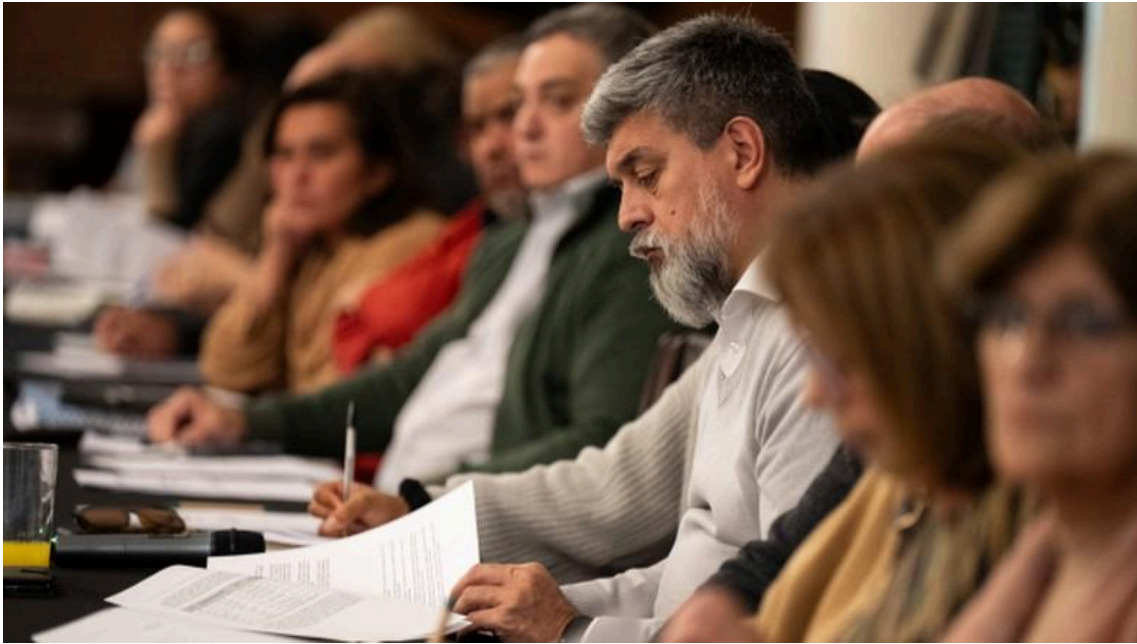
Figura 9- Consejo Departamental de Turismo, 2024.