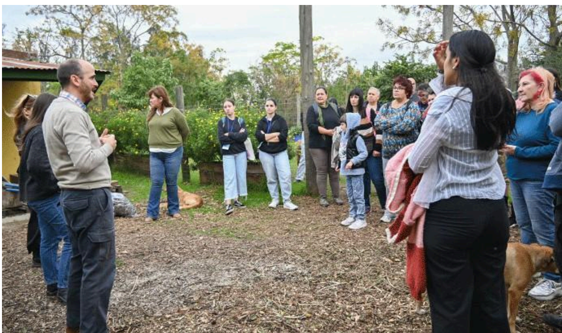
Figura 11-Recorrida en el Vivero Departamental. Fuente: Municipio D