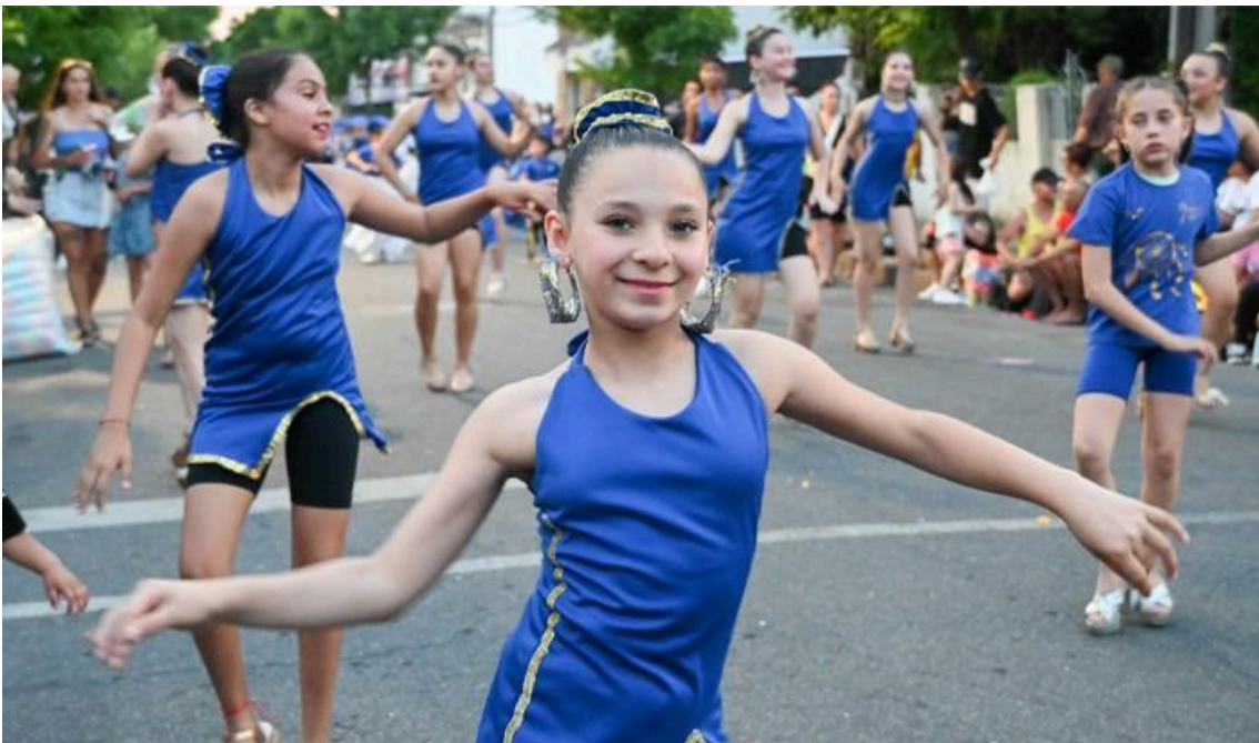
Figura 12-Llamadas del Cerrito 2024.