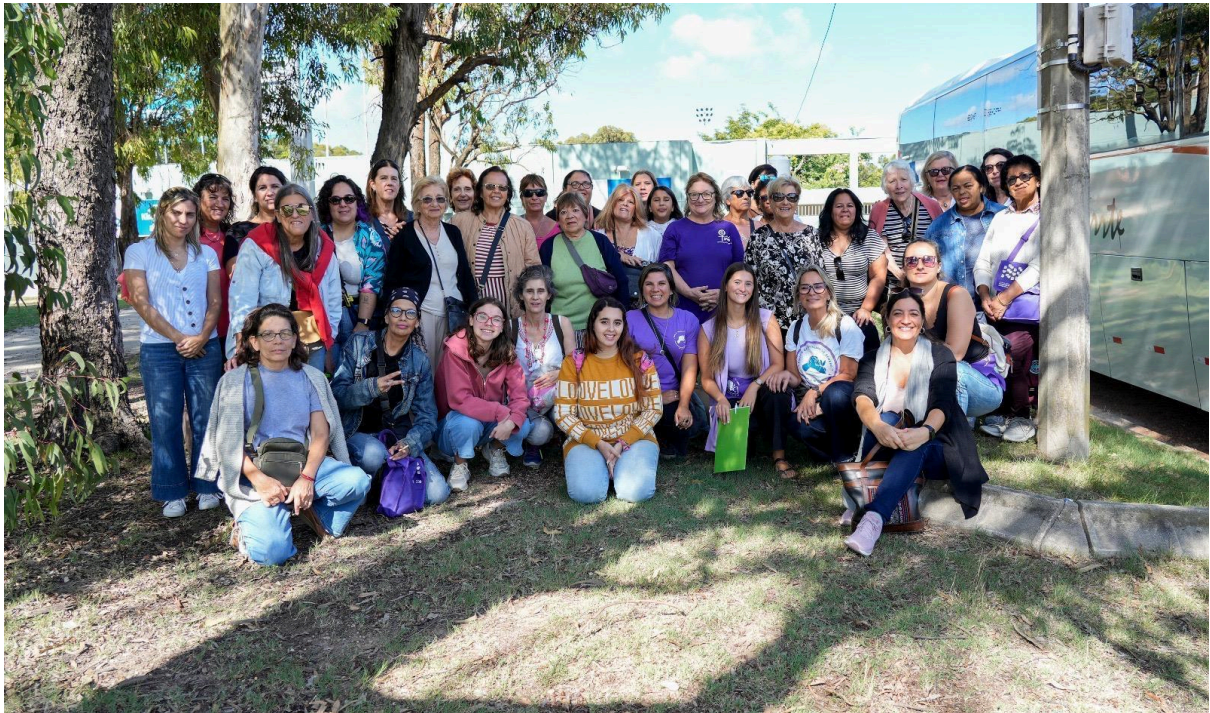
Figura 1. Grupo de la Ruta Violeta 2025.

Además, en línea con estos objetivos, el municipio ha impulsado diversas jornadas y tours temáticos organizados en el marco del turismo social, facilitando el acceso a experiencias turísticas para distintos sectores de la población y promoviendo el conocimiento del patrimonio local. Algunos de los circuitos realizados en el último año fueron la Ruta Violeta (ver figura 1), el recorrido por motivo del Día de las Plazas o el recorrido por los Humedales del Parque Baroffio.