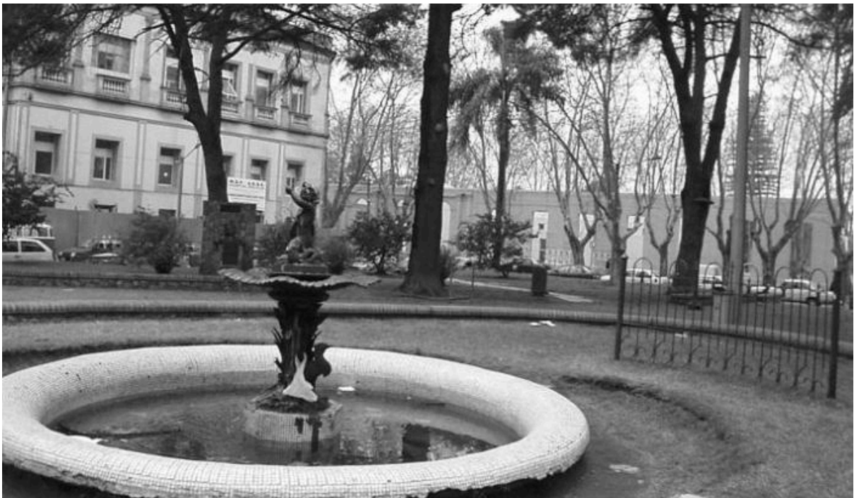
Figura 5. Plaza de la Restauración, La Unión.

Se caracteriza también por sus grandes áreas verdes, como el Parque Rivera, Plaza Virgilio, Parque Baroffio, EcoParque Idea Vilariño y Plaza de la Restauración (figura 5), que actúan como puntos de encuentro para actividades recreativas, deportivas y educativas. Asimismo, alberga destacados edificios patrimoniales, entre los que se incluyen el Sofitel Montevideo Casino Carrasco & Spa, el Molino de Pérez y el Santuario de la Medalla Milagrosa y San Agustín.