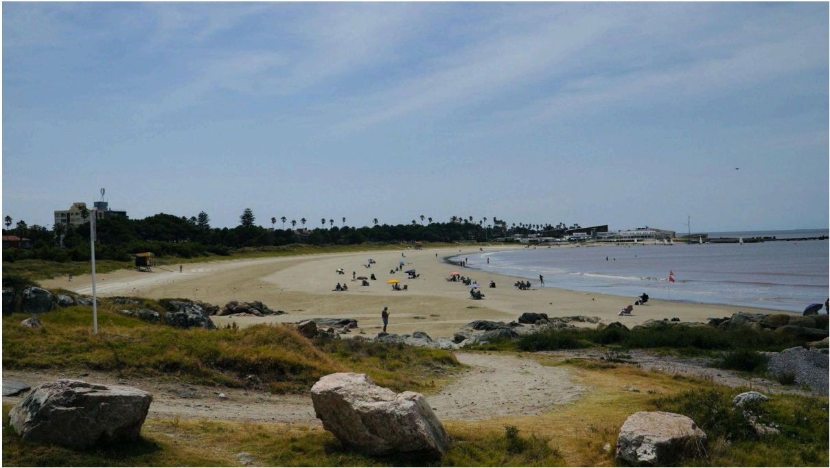
Figura 4. Playa Verde.

Se caracteriza también por sus grandes áreas verdes, como el Parque Rivera, Plaza Virgilio, Parque Baroffio, EcoParque Idea Vilariño y Plaza de la Restauración (figura 5), que actúan como puntos de encuentro para actividades recreativas, deportivas y educativas. Asimismo, alberga destacados edificios patrimoniales, entre los que se incluyen el Sofitel Montevideo Casino Carrasco & Spa, el Molino de Pérez y el Santuario de la Medalla Milagrosa y San Agustín.