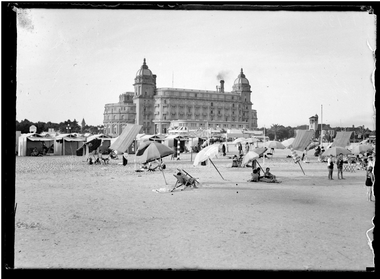
Figura 3. Playa y Hotel Carrasco.

El municipio cuenta con nueve playas: Miramar, Carrasco, La Mulata, Verde (figura 4), De los Ingleses, Honda, Brava, Malvín y Playa del Buceo. Cinco de estas cumplen con las normas internacionales de gestión ambiental ISO 14001 y UNIT-ISO 14001, según evaluaciones del Instituto Uruguayo de Normas Técnicas (UNIT). El alcance implica el agua, la arena, las áreas verdes y las puntas rocosas de estas playas, extendiéndose hacia el exterior hasta 50 metros medidos a partir de la línea de la ribera de cada playa.