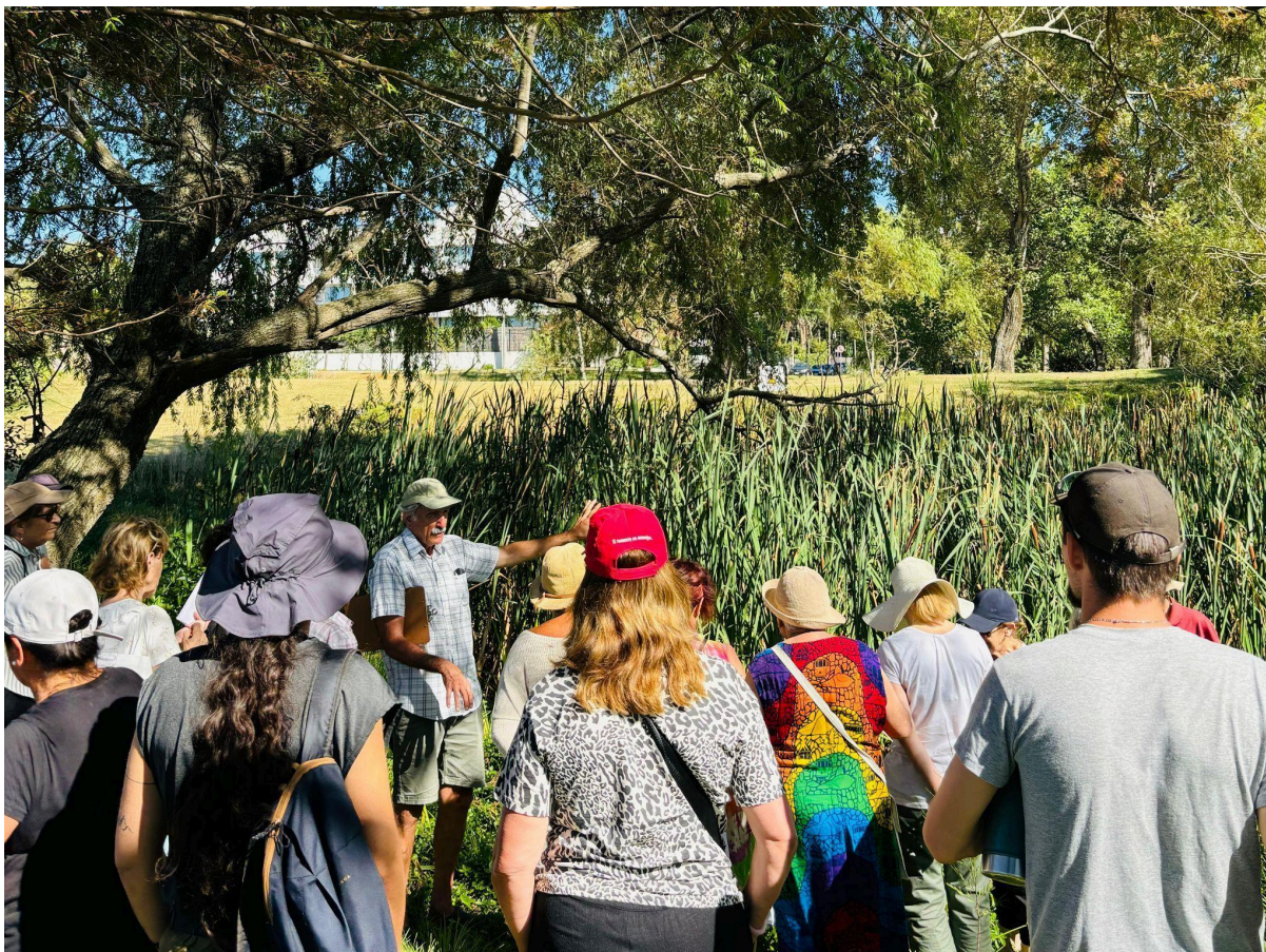
Figura 6. Recorrido por los Humedales del Parque Baroffio.

En cuanto a la promoción turística desde el municipio, se identifican limitaciones en su alcance. Actualmente, la difusión no logra abarcar de manera equitativa todo el territorio del municipio ni alcanzar a todas las franjas etarias. En general, las iniciativas promocionales tienden a captar mayormente a un público adulto, mientras que la participación de la población más joven sigue siendo un desafío.