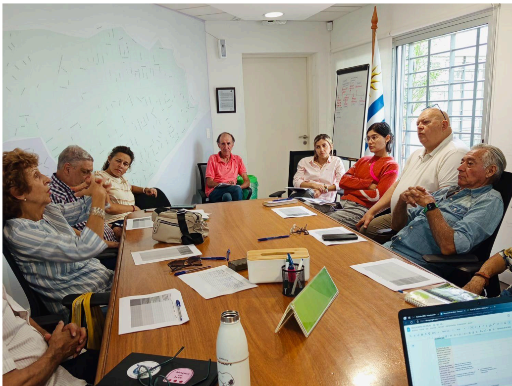
Figura 8. Reunión 27 de Marzo de 2025 junto a Concejales Vecinales.

Este trabajo permitió organizar la segunda etapa, que tuvo como objetivo recibir aportes de diferentes actores y colectivos del territorio. Fueron utilizadas dos técnicas de investigación, envío de encuestas (anexo 1) a emprendimientos turísticos y organizaciones vinculadas a atractivos turísticos y realización de reuniones con otros colectivos y actores clave del territorio (figura 8).